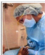
糖尿病療養指導室での施行の様子