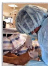
透析室での施行の様子